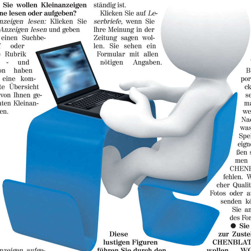
Diese lustigen Figuren führen Sie durch den neuen WOCHENBLATT-Internet-Auftritt

Anzeigen aufgeben: Klicken Sie auf Anzeigen aufgeben . Sie erhalten eine Gebiets- und Preisübersicht. Klicken Sie dann auf „Anzeige aufgeben“ und Sie werden mit Hilfe eines kinderleichten Menues an Ihr Ziel geführt.